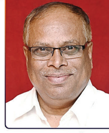
गजानन एम्. धुमाळ उपाध्यक्ष